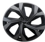
platišča iz lahke litine 51 cm (20") Daytona