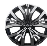
platišča iz lahke litine 51 cm (20") Effie