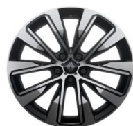
platišča iz lahke litine 48 cm (19") Komah

S = Serijsko O = Opcija P = V paketu - = Ni na voljo